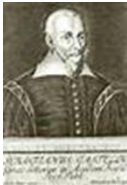
Sébastien Castellion (1515-1563)