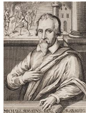
Michel Servet (1511-1553)