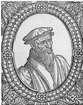
Jean Calvin (1509-1564)