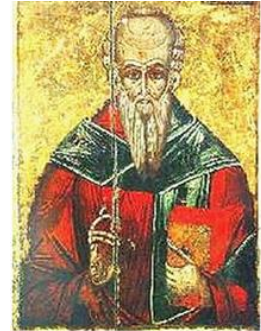
Pour Clément d'Alexandrie, l'un des Pères de l'Église, le gnostique est un chrétien accompli

« De façon très générale, la Gnose (du grec γνῶσις, gnôsis : connaissance) est un concept philosophico-religieux selon lequel le salut de l'âme passe par une connaissance (expérience ou révélation) directe de la divinité, et donc par une connaissance de soi. C'est en acquiesçant à la bonté essentielle de la création que Clément d'Alexandrie entra dans la foi chrétienne. Comme Justin le Philosophe, il accorda sa préférence philosophique à Platon qui, selon lui, s'approchait le plus de la Vérité chrétienne.